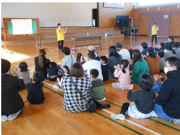
1年 手話ミュージック

辰野町ボランティアセンター様、障がい者スポーツ協会様、手話ミュージックリユシオール様、ご指導いただき、大変ありがとうございました。