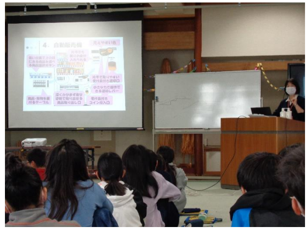
6年 ユニバーサルデザイン