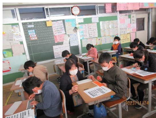
4年 点字を打ってみよう