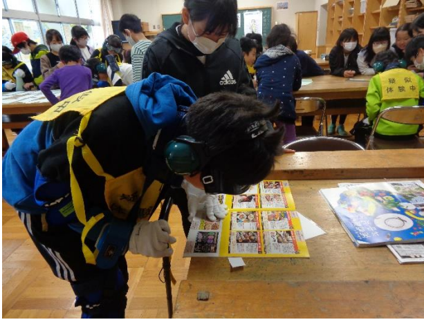
5年 高齢者疑似体験